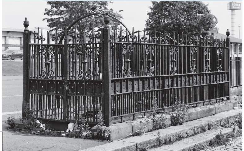
Ancien travail public au milieu du centre commercial Gallowgate

Initialement prévue pour être dévoilée en novembre 2020, portée par le festival Photo Marseille, l'exposition For Whom The Bell Tolls (Go) se penche sur la ville de Glasgow depuis le Centre Photographique Marseille. Elle sera visible tout l'été, englobée dans le Grand Arles Express des Rencontres d'Arles.